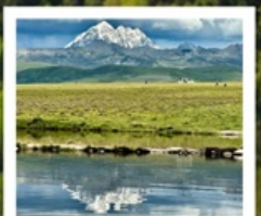
ดวงตาแห่งต่าง

หมู่บ้านทิเบตเจียจวี • จุดชมวิวกุหลาบหิมะหยา • ป่าห่มย สวนหินปาหลาง • จุดชมวิวดวงตาแห่งต่าง • วัดมู่หย่า หมู่บ้านเก๋อริ้อหมาซุน • ซินตูเฉียว • หมู่บ้านกุ่มงซุน หมู่บ้านปาหลางเฉิงตู • เมืองลอยฟ้าเก๋ดีลามู่ • ภูเขาจ้อตั่วชาน ถนนสายรุ้ง • ทะเลสาบแดง • ถนนคนเดินชอยกว้างแคบ