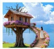
หมู่บ้านเหวินปี้