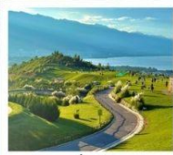
กุขาววินเซียงซาน