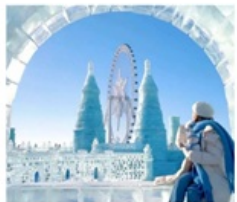
ICE & SNOW FEST.