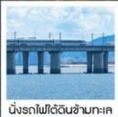
นั่งรถไฟใต้ดินข้ามทะเล