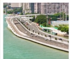
สะพานเหยียนหวู่เจียว