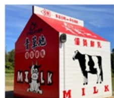
ฟาร์มโคนมจินเหมิน