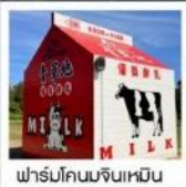
ฟาร์มโคนมจินเหมิน