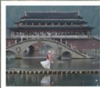
เมืองโบราณฟังหวง