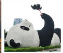
รูปปั้นหมีแพนด้าชหลี่