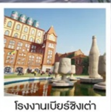
โรงแรมเบียร์ชิงเต่า