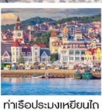
ท่าเรือประมงเหยียนโก๋

เรือลิววิส / ย่านฮั่นเล่อฟาง / ถนนฮั่วจวิปา ท่าเรือประมงเหยียนโก๋ / ย่านองโหว่1920 / ถนนโบราณเฉาหยาง หอคอยกาลเวลา / ชายหาดจินซา / รูปปั้นปลาวาฬ / หาดทรายขาจื่อโหว่ หาดไซเบอร์ NO.3 / โรงงานเบียร์ชิงเต่า / โบสถ์ St. Emil ถนนคนเดินไต้ตง / สะพานจันเฉียว / จัตุรัส 54 / ห้าง MIXC