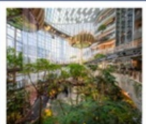
THE RING MALL