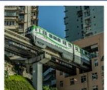
นั่งรถไฟทะลุติ๊ก