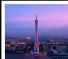
แคนตันทาวเวอร์