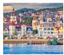
ท่าเรือประมงเหยียนโก๋