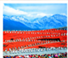
ໂຮງຈາງອວີໂຫມ