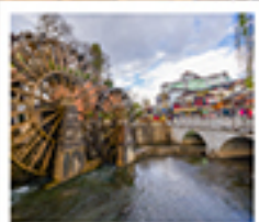
ເມືອງໂບຣາຊນສີ່ເຈີຍງ