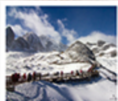
ກຸຫາສິນເມັງກຮຸກ