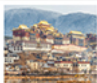
วัดซงจ้านหลิง