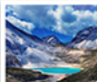
ทะเลสาบน้ำนม