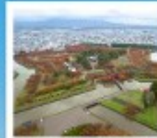
โทริยิวกะกุ ทาวเวอร์

หุบเขานรกจิโตะคุดาบิ / โทดองฮังของคานามิชิ ตลาดเช้าเมืองฮาโกดาเตะ / โทริยิวกะกุ ทาวเวอร์ ภูเขาไฟอุสุ / จุดชมวิวยูซึกิ / ค่องเรือชมทะเลสาบโทบะ สวนอุสึกิโตะ / สวนพฤกษศาสตร์ / เก็บผลไม้ / สัมผัสน้ำพุร้อน พิพิธภัณฑ์คองดงดริ / นาฬิกาไอน้ำโบราณ / โรงเบียร์โทบะ เบียร์คองดงดริ / ถนนฮิโอบังทากุโกจิ / ย่านซูซุกิโนะ