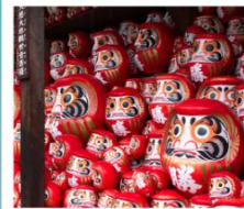
วัดคิตสึโอจิ