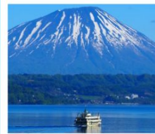
ช่องเรือทะเลสาบโทยะ