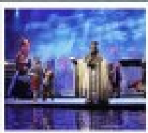
โรว์ซานทิก

มหาศาลาประชาคม / จิตูริตอาทึนทอน ทงชวงซิ่ง / ทอนท่าถ่านจื่อ / ลงเรือสำราญ แม่น้ำแยงซีเกียง โรว์ซานทิก / ซองทอนฮว้ทังเซียบ / ซองทอนตุเซียบ / บั้งเรือทึกรวมเสนหนี่ฮ ซมเรือ่นซานทิงถ่าป้า / ถั่งคัพฟ่าวามเรือ่นซานทิงถ่าป้า / ฆม็องทอนทื่อ่นทอนทิง