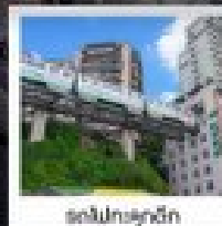
สวนโมกโชติ

ทัวร์คุณภาพ ไม่ลงร้านฮ้อปปีง • ไม่ขายออฟชั่น