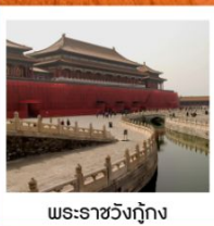
พระราชวังกู่กง