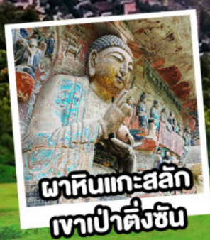
พาหีนแกะสลัก เขาป่าตึงชัน

หรือชื่อ Option : เที่ยวตัวจู้ One Day Trip