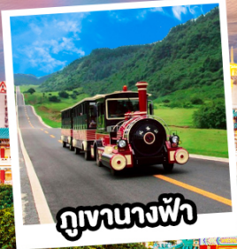
ภูเขาทางฟ้า