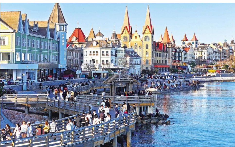
ริมหาดแห่งนี้

นำท่านเดินทางสู่แลนด์มาร์คยอดนิยมของเมืองเยียนโก ณ ท่าเรือชาวประมง แหล่งท่องเที่ยวริมทะเลที่โดดเด่นด้วยสถาปัตยกรรมสไตล์ยุโรป สีสดใส ให้ความบรรยากาศโรแมนติกคล้ายเมืองชายฝั่งในยุโรป ภายในพื้นที่รายล้อมไปด้วยร้านค้า คาเฟ่ และร้านอาหารทะเลสดใหม่ ให้ท่านได้เดินเล่นพักผ่อน พร้อมเพลิดเพลินกับวิวทะเลและอากาศบริสุทธิ์ อีกทั้งยังมีมุมถ่ายรูปสวยๆ มากมาย ไม่ว่าจะเป็นอาคารหลากสี ท่าเรือ หรือฉากหลังเป็นทะเลกว้างสุดสายตา อีสาระให้ท่านเก็บภาพความประทับใจ และสัมผัสเสน่ห์ของเมืองท่า