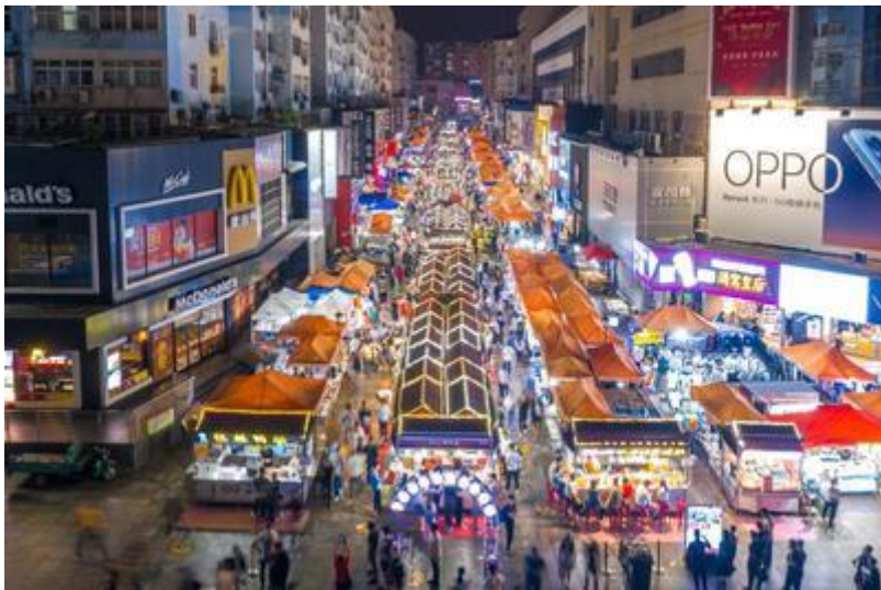
เมืองอย่างแท้จริง

นำท่านเยี่ยมชมแหล่งท่องเที่ยวชื่อดังของเมือง ณ พิพิธภัณฑ์เบียร์ชิงเต่า สถานที่ที่บอกเล่าประวัติความเป็นมาของเบียร์ระดับโลกของจีน ซึ่งก่อตั้งมาตั้งแต่ยุคอาณานิคมเยอรมัน ภายในพิพิธภัณฑ์ ท่านจะได้เรียนรู้ขั้นตอนการผลิตเบียร์ตั้งแต่กระบวนการคัดเลือกวัตถุดิบ การหมัก ไปจนถึงการบรรจุ พร้อมชมเครื่องจักรและอุปกรณ์ดั้งเดิมที่ยังคงอนุรักษ์ไว้เป็นอย่างดี ไฮไลท์พิเศษ ให้ท่านได้ลิ้มรส เบียร์ชิงเต่า รสชาติเย็นสดชื่น ท่านละ 1 แก้ว สัมผัสเอกลักษณ์ของเบียร์ชื่อดังระดับโลกอย่างใกล้ชิด จากนั้นอิสระให้ท่านเลือกซื้อของที่ระลึกหรือผลิตภัณฑ์เกี่ยวกับเบียร์