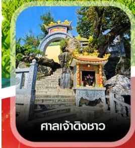
ศาลเจ้าดิ้งเซา