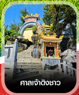
ศาลเจ้าดิ้งซาอ