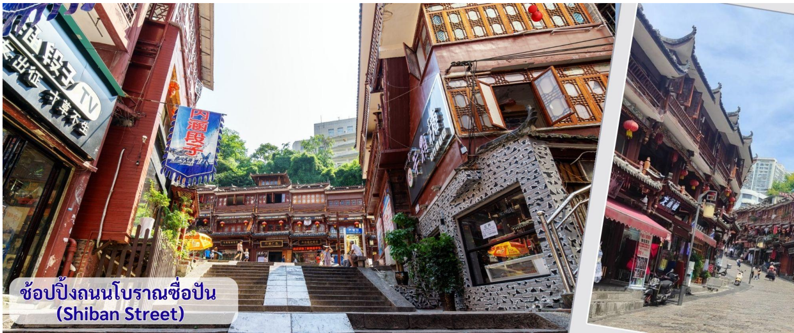
ช้อปปิ้งถนนโบราณช้อปปิ้ง (Shiban Street)

จากนั้นนำทุกท่าน เดินถนนโบราณ Feng Huang Ancient Town ที่ถนนช้อปปิ้ง Shibanshi Street เมืองที่ยังคงรักษาเอกลักษณ์ความเป็นพื้นเมืองผสมผสานกับยุคปัจจุบันเอาไว้ได้อย่างลงตัววิถีชีวิตของชาวบ้านที่อาศัยอยู่ที่นี้ บรรยากาศในเมืองเฟิงหวาง ถนนเก่าช้อปปิ้งเป็นถนนปูหินแคบๆ กว้างไม่ถึง 5 เมตร ทอดยาวจากทางเข้าวัดเต้าเหมินไปทางทิศตะวันตกผ่านถนนหลายสาย ได้แก่ ถนนครอส ถนนเจิ้งตวันออก ถนนเจิ้งตวันตก ศาลาฮุยหลง หียงเซียวซง เต้าซานลา ศาลาเจี้ยกัว และสุสานเซินฉงเหวิน สุดท้ายจะนำไปสู่ “น้ำพุแรกใต้ฟ้า” ถนนสายนี้มีความยาวกว่า 3,000 เมตร และเป็นย่านการค้าที่คึกคักที่สุดในเฟิงหวาง