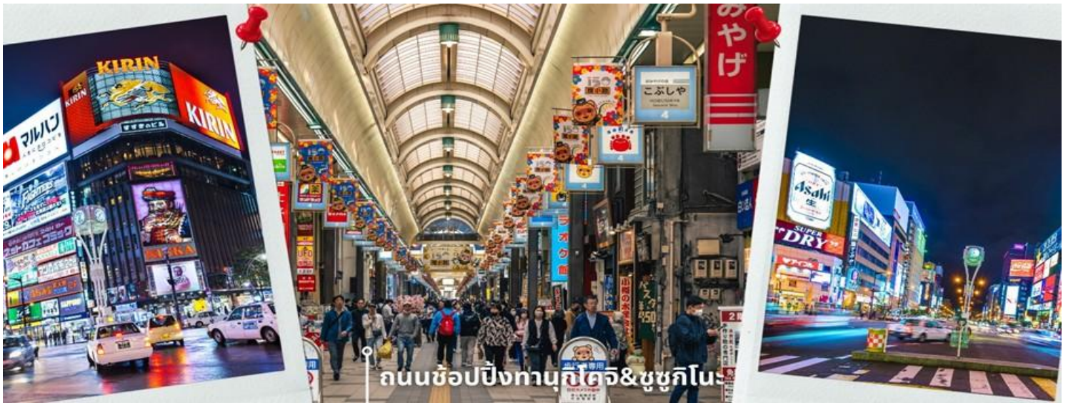
ถนนช้อปปิ้งทานุกิโคจิ&ชูชุกิโนะ

รายล้อมด้วยภูเขาและป่าสนที่ปกคลุมด้วยหิมะขาวโพลน กิจกรรมนี้ถือเป็นอีกหนึ่งเสน่ห์ของการท่องเที่ยวฤดูหนาวที่ผสมผสานทั้งความสุข ความตื่นเต้น และบรรยากาศสุดพิเศษไว้ในช่วงเวลาเดียวกัน เหมาะสำหรับผู้ที่ต้องการสัมผัสประสบการณ์ใหม่ ๆ พร้อมเก็บภาพความประทับใจท่ามกลางวิวหิมะสุดอลังการ พอสมควรแก่เวลา นำท่านเดินทางสู่ ถนนช้อปปิ้งทานุกิโคจิ เป็นถนนช้อปปิ้งที่ตั้งอยู่แทบจะใจกลางเมือง Sapporo โดยมีร้านค้า ร้านอาหาร ห้างสรรพสินค้า ร้านเกม และโรงแรม รวมกันมากกว่า 200 เรียงรายยาวตั้งแต่ทิศตะวันตกยันทิศตะวันออกยาวถึง 1 กิโลเมตร และยังมีบันไดเลื่อนลงไปทางเดินใต้ดินอีกด้วย ซึ่งทางเดินใต้ดินก็ยังมีร้านค้า ร้านอาหารอีกมากมายด้วยเช่นกัน ถนนช้อปปิ้งแห่งนี้เป็นที่ที่หลังคาแทบจะตลอดทาง ดังนั้นแล้วไม่ว่าจะฝนตก หิมะตก หรือแดดแรง ก็ยังสามารถเดินช้อปปิ้งที่ถนนแห่งนี้ได้เหมือนเดิม และย่านชูชุกิโนะ เป็นย่านช้อปปิ้งและบันเทิงใหญ่ที่สุดในซัปโปโร ตั้งอยู่ใจกลางเมืองและตั้งอยู่บริเวณรอบๆสถานีรถไฟใต้ดินชูชุกิโนะ อยู่ห่างไปไม่กี่กิโลจากสวนสาธารณะโอโดริประมาณ 500เมตรและอยู่ไม่ไกลจากถนนทานุกิโคจิ ย่านนี้เป็นที่นิยมของทั้งคนท้องถิ่นและนักท่องเที่ยว ย่านนี้เต็มไปด้วยร้านค้ามากมาย ทั้งสินค้าแฟชั่น สินค้าแบรนด์เนม ของฝาก ของที่ระลึก และสินค้าอุปโภคบริโภคต่างๆ รวมถึงสถานบันเทิงยามค่ำคืน ให้เวลาท่านได้เดินช้อปปิ้งตามอัธยาศัย