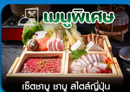
เช็ตเตาบุ ซาซู สีสต์ญี่ปุ่น