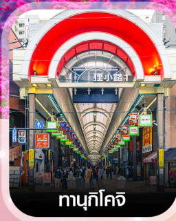
ทามุกิโคจิ

คอนเฟิร์ม ออกเดินทาง ทุกพีเรียด 2 ท่านขึ้นไป