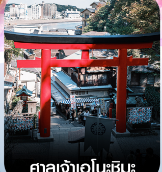
ศาลเจ้าอินะชิมะ