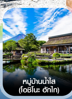
หมู่บ้านน้ำใส (โอชิโนะ อักไก)

✈️ คอนเฟิร์มออกเดินทาง ทุกพีเรียด 2 ท่านขึ้นไป