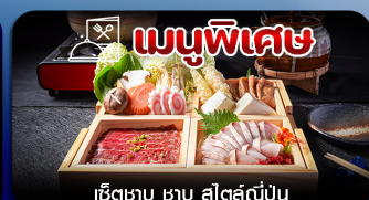
เมนูพิเศษ เซตซาซู ซาซู สีสต์ญี่ปุ่น

โตเกียว-ฟูจิ-คามิโคจิ-ทะเลสาบคาวากุจิโกะ-หมู่บ้านน้ำใส-เมืองเก่าคาวาโกเอะ-คารุชิวาว่า-อีสระช้อปปิ้งเต็มวัน