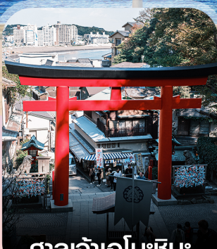
ศาลเจ้าเอโนะชิมะ