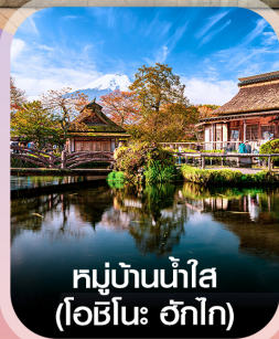
หมู่บ้านน้ำใส (โอะชิโนะ อักโท)

✈️ คอนเฟิร์มออกเดินทาง ทุกพีเรียด 2 ท่านขึ้นไป