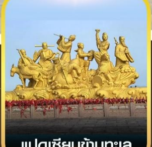
แปดเซียนข้ามทะเล