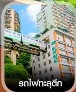
รถไฟทะลุติ๊ก