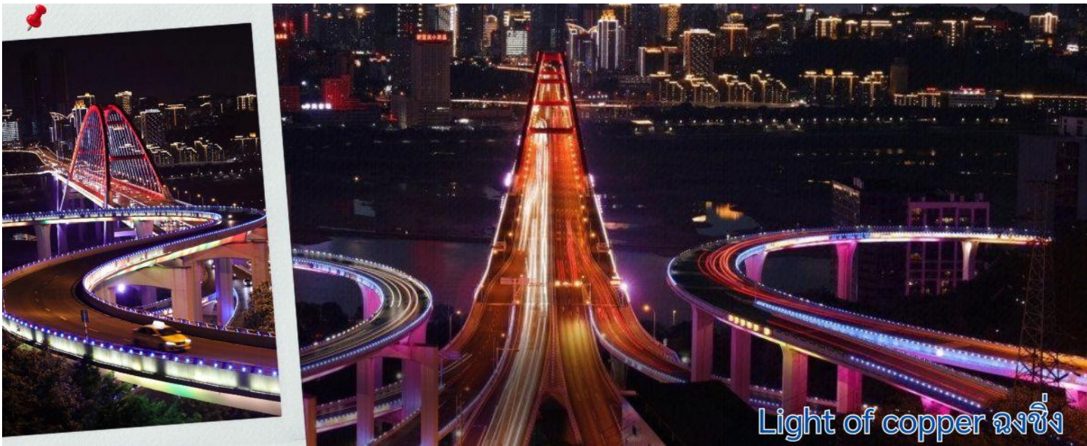
Light of copper ฉงชิ่ง

แนวถ่ายรูปวิวที่ Light of copper ฉงชิ่ง เป็นจุดชมวิวดังในมหานคร ฉงชิ่ง ประเทศจีน ซึ่งได้รับความนิยมอย่างมากในกลุ่มนักท่องเที่ยวและช่างภาพ จุดชมวิวดังยกระดับโดดเด่นด้วยทางเดินลอยฟ้าทรงกลมที่เชื่อมต่อกันสามารถมองเห็นวิวพาโนรามาของ สะพานจูเจียป่า (Sujiaba Interchange) ที่โค้งไปมาอย่างซับซ้อน และสะพานข้ามแม่น้ำแยงซีเกียง ไช่หยวนป่า (Caiyuanba Bridge) ท่ามกลางตึกสูงระฟ้าบรรยากาศยามค่ำคืน เมื่อเปิดไฟเมืองในช่วงค่ำจะเห็นแสงสีทองและสีทองแดง สะท้อนความงดงามของ "เมืองภูเขา" ได้อย่างชัดเจน