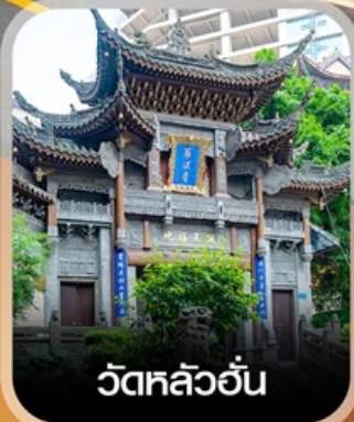
วัดหลิวอัน