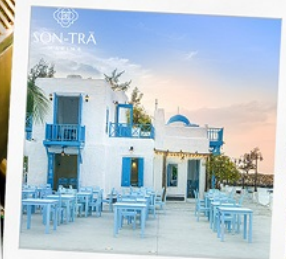
ซานตารีน่าคาเฟ่