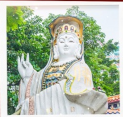
เจ้าแม่กวนอิมธิพลัสเบย์