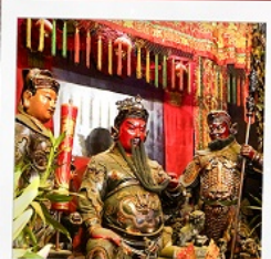
เทพเจ้ากวนอู วัดถวณไถ