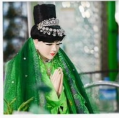
เทพกระซิบ