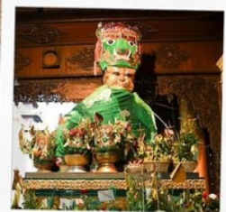
ขอพรแม่ยักษ์