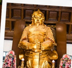
วัดเขาแกงหมิว