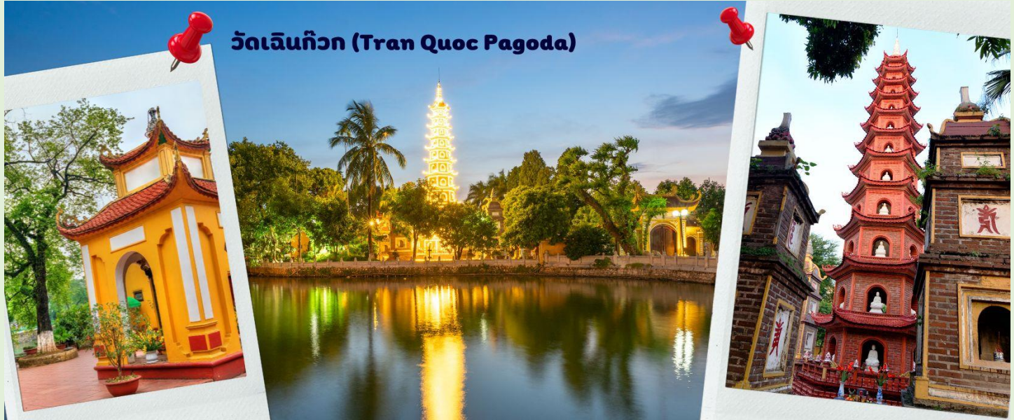
วัดเจินก๊วก (Tran Quoc Pagoda)

จากนั้นนำท่านไป วัดเจินก๊วก (Tran Quoc Pagoda) เป็นวัดที่อยู่ใจกลางเมืองของเวียดนาม ใกล้ชิดกับทะเลสาบตะวันตกของเมืองฮานอย สร้างด้วยสถาปัตยกรรมจีนโบราณ มีความร่มรื่น และบรรยากาศดี จึงเป็นที่นิยมของนักท่องเที่ยวทั้งที่ชื่นชมความงามและมีศรัทธาในพระพุทธศาสนา จากภาพมุมสูงของสถานที่ตั้ง ที่นี้เหมือนตั้งอยู่บนเกาะที่ยื่นลงไปทะเลสาบ แต่มีเส้นทางคมนาคมเข้าถึงที่ สิ่งปลูกสร้างมีการวางผังเป็นอย่างดี ใช้สีสันทึกลมกลืนในโทนสีเหลือง น้ำตาล ตัดกับสีเขียวของต้นไม้ใหญ่ที่โอบล้อมอยู่ ในมุมถ่ายภาพจากอีกฝั่งหนึ่ง จะเห็นสิ่งปลูกสร้างสไตล์จีน และเจดีย์หลายชั้นโดดเด่น มีภาพที่สะท้อนลงสู่ผิวน้ำเป็นภูมิทัศน์ที่งดงามทั้งยามกลางวันและยามค่ำคืนที่มีการเปิดไฟส่องสว่าง