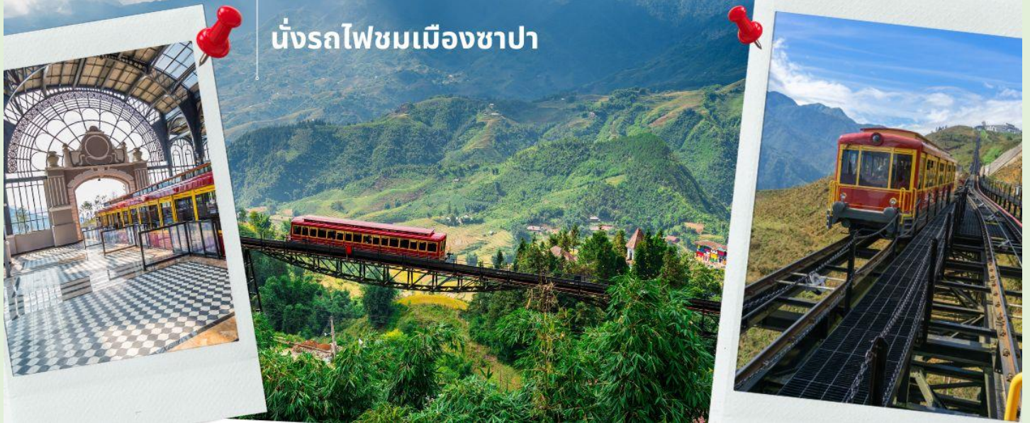
นั่งรถไฟชมเมืองซาปา

นำท่าน นั่งรถไฟชมเมืองซาปา (รวมค่ารถไฟชมเมือง) ท่านจะได้พบกับวิวทิวทัศน์ของเมืองซาปาที่เต็มไปด้วยความสดชื่น และสุดกลิ่นอายธรรมชาติ และยังตื่นตาไปด้วยวิวภูเขา และนาขั้นบันได ที่มีชื่อเสียงของเมืองซาปาอีกด้วย ความยาวประมาณ 2 กิโลเมตร โดยใช้เวลาประมาณ 20 นาทีเพื่อไปสู่สถานีขึ้นกระเช้าที่จะนำท่านขึ้นสู่ยอดเขาฟานซีปัน