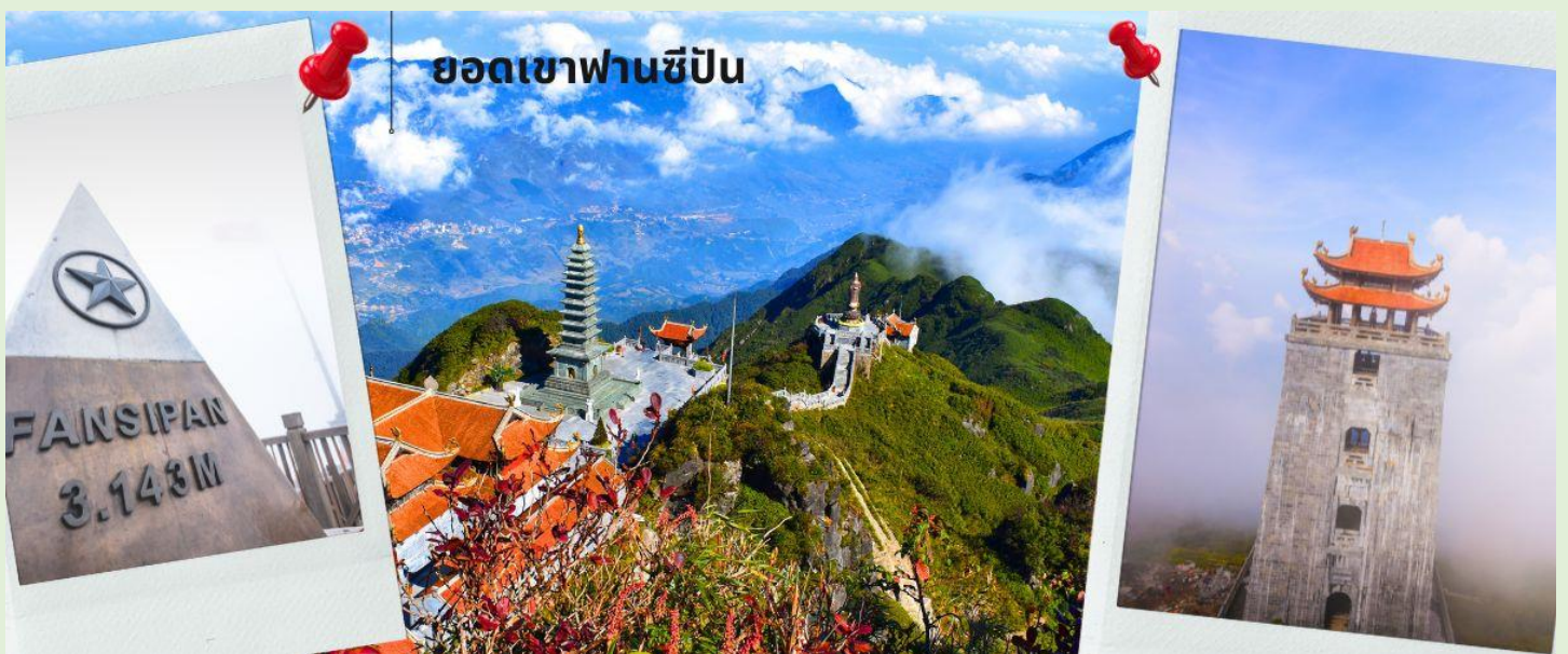
ยอดเขาฟานซีปัน

จากนั้นนำท่าน นั่งกระเช้าขึ้นเขาฟานซีปัน (รวมค่ากระเช้าขึ้นเขา) ข้ามภูเขากว่า 7 กิโลเมตร ใช้เวลาประมาณ 15 นาที ข้ามเทือกเขาอันยิ่งใหญ่มากมายสู่เทือกเขา ฟานซีปัน ท่ามกลางมวลเมฆหมอกที่ลอยละล่องอยู่รอบ ๆ ชมทัศนียภาพที่แสนสวยงามบนจุดชมวิวในระดับความสูง 3,143 เมตร จุดที่ได้รับการขนานนามว่าเป็นหลังคาแห่งอินโดจีน ด้วยทิวทัศน์แบบพาโนรามาพร้อมสัมผัสอากาศที่หนาวเย็นตลอดทั้งปี ท่านสามารถเดินขึ้นสู่จุดสูงสุดของยอดเขาฟานซีปัน หรือเลือกใช้บริการรถราง (ไม่รวมรถรางขึ้นสู่ยอดเขาฟานซีปัน) เพื่อพิชิตสูงที่สุดในเอเชียตะวันออกเฉียงใต้ หรือหลังคาแห่งอินโดจีน