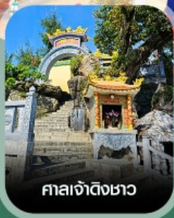
ศาลเจ้าดิ้งซา

เชิควนสนุก VinWonders ใหญ่ที่สุดของเวียดนาม นั่งกระเช้าชมวิวข้ามทะเล สวนสนุกฮอนเท็ม ตื่นตาอควาเรียมรูปเต่า อาณาจักรสัตว์น้ำ