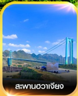
สะพานฮวาเจียง