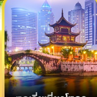
หอเจียเซียงโหลว