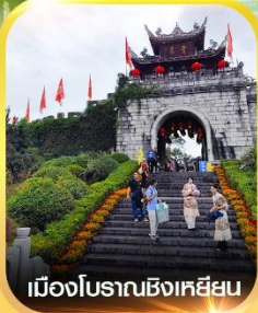
เมืองโบราณซิงเหยียน

คอนเฟิร์ม ออกเดินทาง ทุกพีเรียด 2 ท่านขึ้นไป