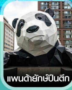
แพนด้ายักษ์ปิ่นตึก

คอนเฟิร์มออกเดินทาง ทุกพีเรียด 2 ท่านขึ้นไป