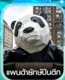
แพนด้ายักษ์ป็นตีก