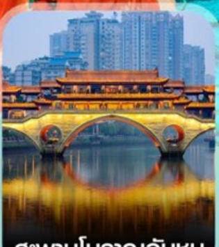
สะพานโบราณอันชุน