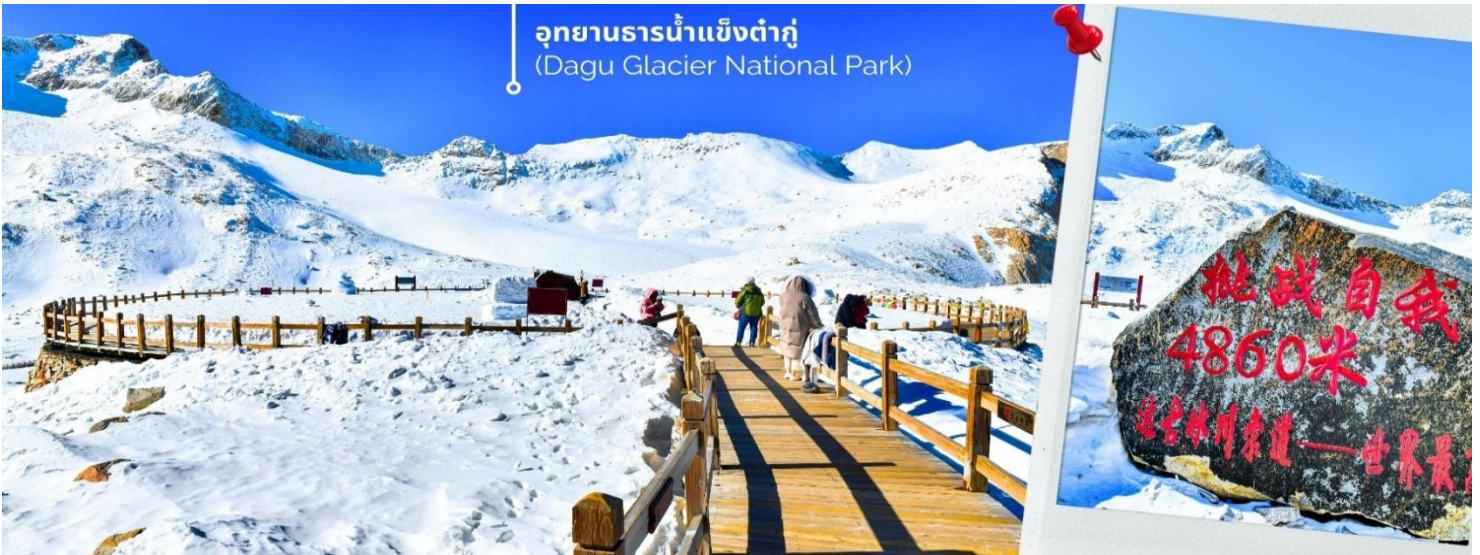
การตกและความหนาวของหิมะขึ้นอยู่กับสภาพอากาศ

จากนั้นนำท่านเดินทางสู่ เมืองเฮยสุ่ย (ใช้เวลาเดินทางประมาณ 2.5 ชั่วโมง) เพื่อเดินทางไปยัง อุทยานธารน้ำแข็งต้ากู่ปังชว่น(รวมกระเช้าขึ้นลง) ต้ากู่ปังชว่น หรือ Dagu Glacier National Park เป็นธารน้ำแข็งกลางเข็วที่สวยงามที่สุดแห่งหนึ่งของโลก และเป็นสถานที่ท่องเที่ยวระดับ 4A ของจีน ตั้งอยู่ที่เมืองเฮยสุ่ย ในมณฑลเสฉวน ห่างจากเมืองเฉิงตูประมาณ 300 กิโลเมตร ถือเป็นธารน้ำแข็งที่อายุน้อยที่สุด ที่ตั้งอยู่ในระดับความสูงที่ต่ำที่สุด และอยู่ใกล้กับเมืองมากที่สุดในบรรดาธารน้ำแข็งทั้งหมด โดยอยู่สูงจากระดับน้ำทะเลประมาณ 3,800-5,100 เมตร จุดสูงที่สุดที่นักท่องเที่ยวสามารถขึ้นไปได้จะอยู่ที่ 4,860 เมตร