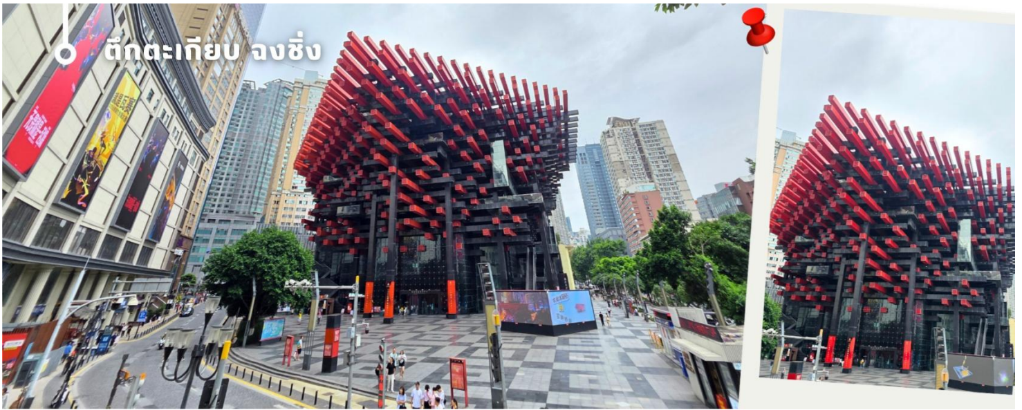
ตึกตะเกียบ จงชิ่ง

เอกลักษณ์ อาคารนี้ถูกวางโครงสร้างให้มีรูปร่างคล้ายกอง "ตะเกียบยักษ์" สีดำและแดงที่วางซ้อนกันเป็นชั้นๆ ที่ส่วนปลายของตะเกียบสีแดงจะมีตัวอักษรจีนคำว่า "กั่ว" ประทับอยู่ ซึ่งมีความหมายถึง ชาติหรือประเทศ ส่วนที่ปลายตะเกียบสีดำ จะมีอักษรจีนคำว่า "ไท่" ประทับอยู่ ซึ่งหมายถึง ความเงียบสงบ หรือความอุดมสมบูรณ์