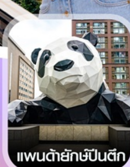
แพนด้ายักษ์ป็นตึก

✈️ คอนเฟิร์มออกเดินทาง ทุกพีเรียด 2 ท่านขึ้นไป