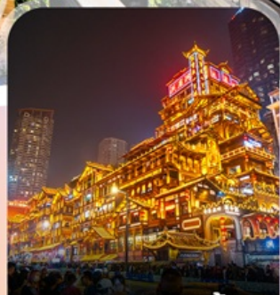
ตลาดหงหย่าตัง