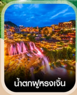
น้ำตกฟูหลงเจิน

สัมผัสสายหมอกแห่งขุนเขา สะพานอ้ายจ้าย แบบพาโรนา แช่น้ำพุร้อนกลางธรรมชาติ อุทยานป่าไม้บูเออร์เหมิน ชมความอลังการ น้ำตกพันปี หมู่บ้านโบราณผู่หลงเจิน