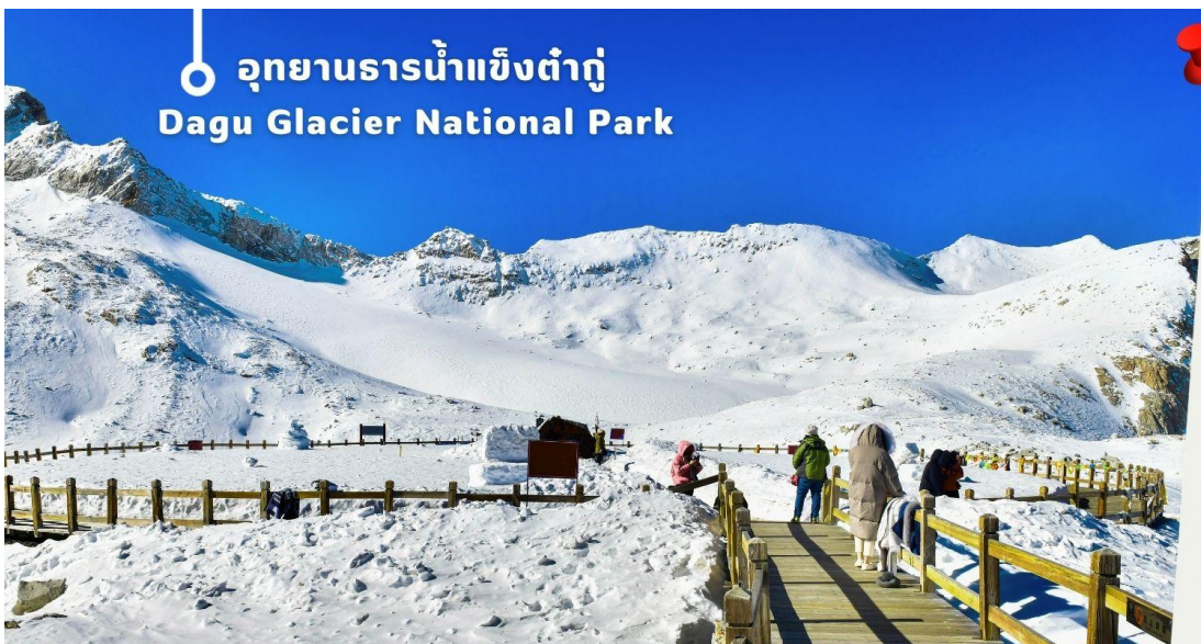
อุทยานธารน้ำแข็งต้ากู่ Dagu Glacier National Park

จากนั้นนำท่านเดินทางสู่ เมืองเฮยซู่ (ใช้เวลาเดินทางประมาณ 2 ชั่วโมง)เพื่อเดินทางไปยัง อุทยานธารน้ำแข็งต้ากู่ (รวมกระเช้าขึ้นลง) ต้ากู่ปังชว่น หรือ Dagu Glacier National Park เป็นธารน้ำแข็งกลาเซียร์ที่สวยงามที่สุดแห่ง