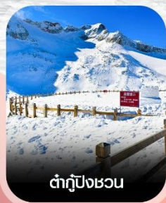
ตำกู่ปิงชวอน

✈️ คอนเฟิร์มออกเดินทาง ทุกพีเรียด 2 ท่านขึ้นไป ✈️