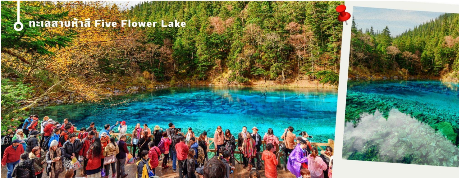
ทะเลสาบห้าสี Five Flower Lake

หนึ่งในจุดที่สวยงามและนักท่องเที่ยวแวะมาเยี่ยมชมเยอะที่สุด ตั้งอยู่ที่ความสูงเหนือระดับน้ำทะเลประมาณ 2,472 เมตร น้ำลึกประมาณ 5 เมตร น้ำใสมองเห็นพื้นด้านล่างของทะเลสาบ สีของผิวน้ำสวยงามแปลกตา โดยเฉพาะเมื่อยามแสงอาทิตย์สาดส่องกระทบผิวน้ำ สีของน้ำในทะเลสาบจะสะท้อนเป็นสีส้มถึง 5 เฉดสี สวยงามสะกดตา ซึ่งสาเหตุที่ทำให้เกิดสีสันต่างๆ นี้มาจากการสะสมของแร่ธาตุ และพืชน้ำชนิดต่างๆ โดยจะมีสีสันแตกต่างกันไปตามฤดูกาลและช่วงเวลา ยิ่งถ้ามาในช่วงฤดูหนาว ต้นไม้ริมทะเลสาบจะเต็มไปด้วยหิมะสีขาวตัดกับสีของทะเลสาบ ดูสวยงามแปลกตา