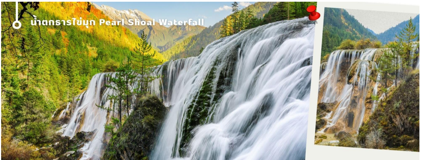
น้ำตกธารไข่มุก Pearl Shoal Waterfall