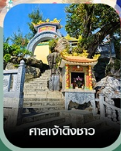
ศาลเจ้าดิ้งซาอว

เชิควนสนุก VinWonders ใหญ่ที่สุดของเวียดนาม นั่งกระเช้าชมวิวข้ามทะเล สวนสนุกออนเท็ม ตื่นตาอควาเรียมรูปเต่า อาณาจักรสัตว์น้ำ