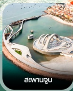
สะพานจูป