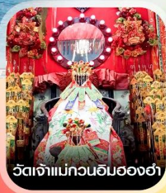
วัดเจ้าแม่กวนอิมอองฮา