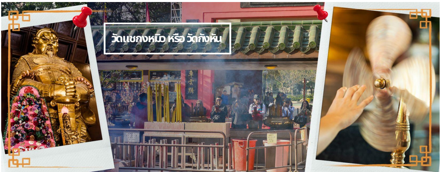
วัดแชกงหมิว หรือ วัดกังหัน

จากนั้นนำท่านเดินทางไป วัดแชกงหมิว หรือ วัดกังหัน (CHE KUNG TEMPLE) วัดแชกงสร้างขึ้นเพื่อเป็นอนุสรณ์เพื่อรำลึกถึงตำนานแห่งนักรบราชวงศ์ซ่ง มีนามว่า “แช กง” แม่ทัพปราบศึก ผู้คนทั่วทุกดินแดนต่างยำเกรงในกำลังพลอันกล้าหาญแข็งแกร่งของแม่ทัพแชกง เป็นวัดเก่าแก่ที่มีความศักดิ์สิทธิ์มาก มีอายุกว่า 300 ปีตั้งอยู่ในเขต SHATIN มีประวัติเล่าต่อกันมาว่า ขณะที่เป็นแม่ทัพปราบศึกอยู่นั้น ทุกแคว้นเขตแดนแผ่นดินใหญ่ต่างก็ยำเกรงต่อกำลังพลที่กล้าหาญในกองทัพของท่าน ยามที่ออกรบเพื่อต้านข้าศึกศัตรูทุกทิศทาง ทุก ๆ ครั้ง ท่านใช้สัญลักษณ์รูปกำหั้น 4 ใบพัดติดไว้ด้านหลังรถศึกนำขบวนในกองทัพ เหล่าทหารกล้ามีความเชื่อว่าเมื่อพก พาสัญลักษณ์รูปกำหั้นนี้ไป ณ ที่ใด ๆ กำหั้นนี้จะช่วยเสริมสิริมงคล นำพาแต่ความโชคดี เสริมกำลังใจให้แก่กองทัพของท่าน ชื่อเสียงในการนำทัพสู้ศึกของท่านจึงเป็นตำนานมาจนทุกวันนี้ ปัจจุบันวัดแชกง จึงเป็นสถานที่สักการะเคารพ ขอพร ท่านแชกง โดยมีสัญลักษณ์เป็นกำหั้นนำโชค