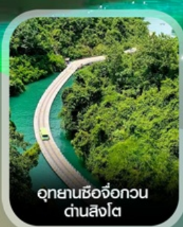
อุทยานซีจื่อกวน ด่านสิงโต