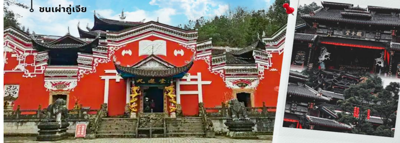
ชนเผ่าถู่เจีย

จากนั้นนำท่านเดินทางสู่ ชนเมืองชนเผ่าถู่เจียเอินซือ เป็นหนึ่งในกลุ่มชาติพันธุ์ที่มีจำนวนประชากรมากที่สุดในเขตนี้ จนทำให้อินซือได้ชื่อว่าเป็น “บ้านของชนเผ่าถู่เจีย” วัฒนธรรมของถู่เจียมีเอกลักษณ์ ทั้งด้านภาษา การแต่งกาย และประเพณีดั้งเดิม เช่น การรำมือ “ปายชั่ว” ซึ่งเป็นการเต้นรำหมู่ที่ใช้ท่ามือและท่าก้าวเท้าในการบอกเล่าเรื่องราว อีกทั้งยังมีเทศกาลเฉพาะของถู่เจีย เช่น เทศกาลปายชั่ว ที่จัดขึ้นเพื่อบูชาบรรพบุรุษและเฉลิมฉลองความเป็นชุมชนชนเผ่าถู่เจียในอินซือเป็นเสน่ห์สำคัญของการท่องเที่ยวเมืองนี้ เพราะนักท่องเที่ยวจะได้ทั้งชมภูมิทัศน์ที่สวยงาม และเรียนรู้วัฒนธรรมชาติพันธุ์ที่ยังคงรักษาขนบประเพณีดั้งเดิมไว้อย่างชัดเจน