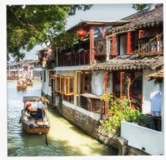
เมืองโบราณจูเจียวเจียว