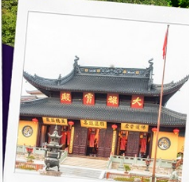
วัดพระหยก