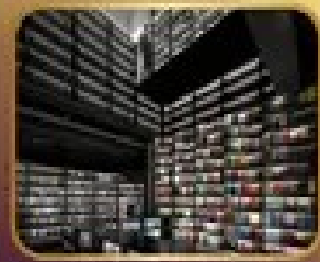
ชมร้านหนังสือ