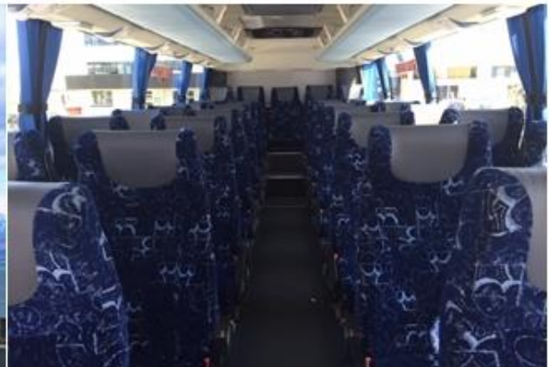
* ลูกค้าจำนวน 15 ท่านขึ้นไป ใช้รถบัสขนาด 30 - 35 ที่นั่ง*