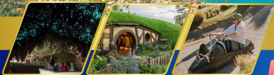
ถ้ำหอนเรื่องแสง หมู่บ้านฮ็อบบิต เล่นลู่ที่ควีนส์ทาวน์

AUCKLAND / ROTORUA / CHRISTCHURCH FOX GLACIER / FRANZ JOSEF / QUEENSTOWN พักอ็อคแลนด์ 2 คืน / โรโตรัว 1 คืน / พักโครสต์เชิร์ช 2 คืน พักฟรานซ์โจเซฟ 1 คืน / ควีนส์ทาวน์ 2 คืน