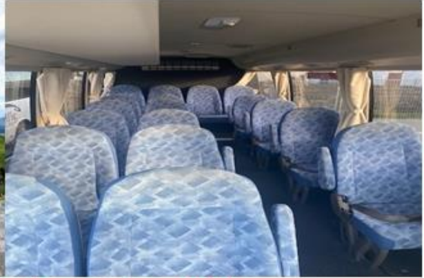
* ลูกค้าจำนวน 10 - 14 ท่าน ใช้รถบัสขนาด 19 - 21 ที่นั่ง*