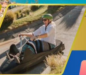
เล่นลู่ ที่ควีนส์ทาวน์

AUCKLAND / ROTORUA / CHRISTCHURCH FOX GLACIER / FRANZ JOSEF / QUEENSTOWN