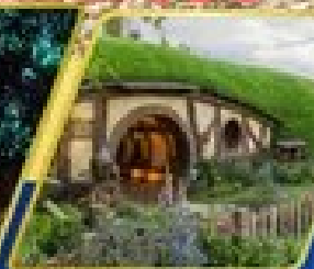
หมู่บ้านฮอบบิต