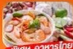
พิเศษ อาหารไทย