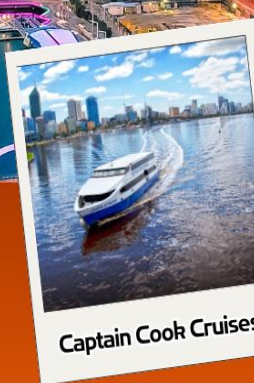
Captain Cook Cruises