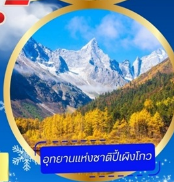
อุทยานแห่งชาติปี้เฟิงโกว