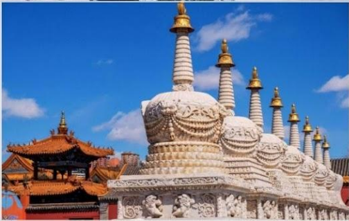
วัดต้าเจา (Dazhao Temple)