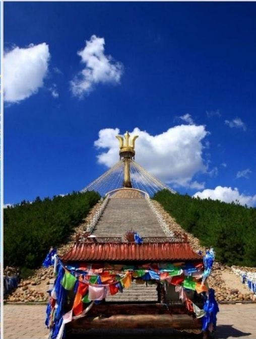
อี้เค่อโอบุ (Great Oboo, 伊克敖包)