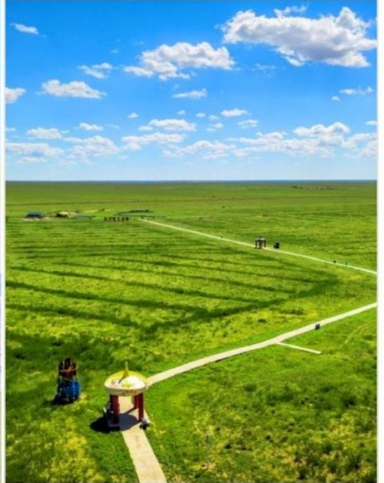
ทุ่งหญ้าออร์ดอส (Ordos Prairie)

บ่าย นำท่านชม ทุ่งหญ้าออร์ดอส (Ordos Prairie, 鄂尔多斯草原) เสน่ห์แห่งมองโกเลียในแหล่งธรรมชาติอันงดงาม ที่ซึ่งท้องฟ้ากว้างใหญ่ทอดยาวเหนือพรมแดนแห่งทุ่งหญ้าเขียวขจีตลอดสาย ผืนฟ้าใบธรรมชาติขนาดใหญ่ที่รอให้คุณมาสัมผัสความงดงามและเสน่ห์อันบริสุทธิ์ ทุ่งหญ้าออร์ดอส ไม่ได้เป็นเพียงแค่พื้นที่กว้างใหญ่ แต่ยังเป็นศูนย์รวมของวัฒนธรรมและประวัติศาสตร์อันยาวนานของชาวมองโกเลีย ที่นี่คุณจะได้เห็น กระจอมเกอร์ (Ger หรือ Yurt) ตั้งเรียงรายอยู่บนเนินหญ้า ตัดกับท้องฟ้าสีคราม และฝูงสัตว์ที่เล็มหญ้าอย่างสงบ นี่คือภาพจำลองชีวิตที่ยังคงรักษาไว้ซึ่งความเรียบง่ายและเป็นอิสระ ทุ่งหญ้าออร์ดอสเป็นสวรรค์ของช่างภาพ ด้วยทิวทัศน์อันกว้างใหญ่ แสงยามเช้าและยามเย็นที่งดงาม และวิถีชีวิตที่น่าสนใจ