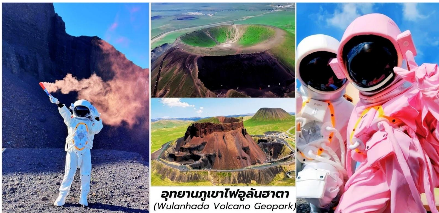
อุทยานภูเขาไฟอูลันฮาตา (Wulanhada Volcano Geopark)

นำท่านชม ภูเขาไฟหมายเลข 6 เป็นภูเขาไฟที่มีลักษณะสีดำเข้มจากหินภูเขาไฟที่ถูกขุดออกไปค่อนข้างมาก ทำให้ดูคล้ายกับพื้นผิวของดวงจันทร์หรือดาวอังคารอย่างชัดเจน ที่นี่เป็นจุดยอดนิยมสำหรับการถ่ายภาพ โดยเฉพาะอย่างยิ่งกับการเช่า พิเศษ...สวมชุดนักบินอวกาศ (รวมค่าชุดแล้ว) ใสเพื่อสร้างบรรยากาศ "การสำรวจอวกาศ"