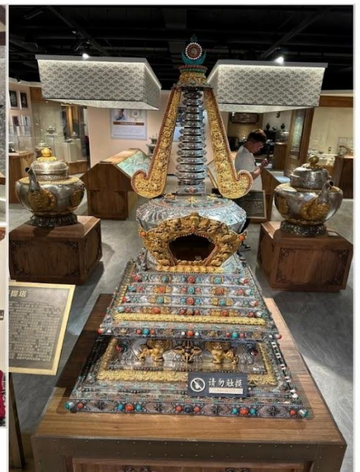
ร้านเครื่องเงินมองโกล