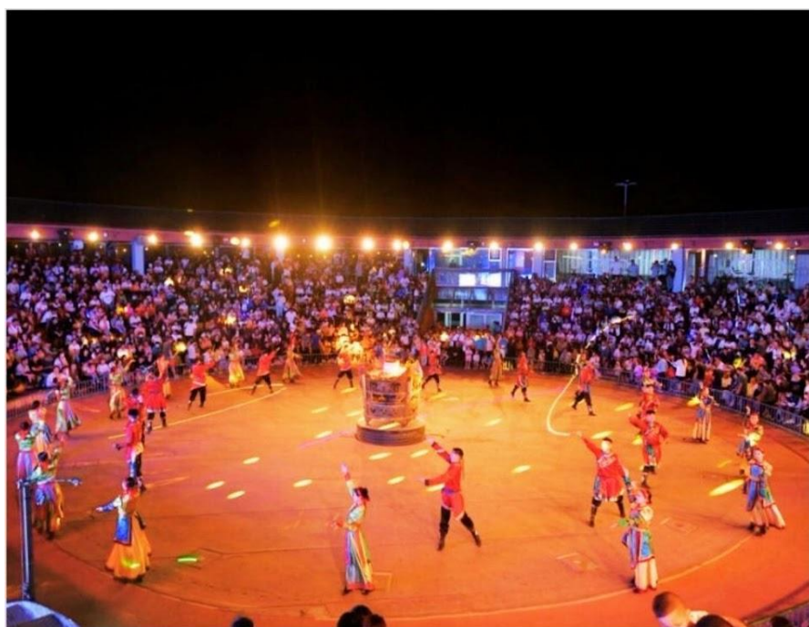
งานราตรีรอบกองไฟมองโกล

ที่พัก MONGOLIC YURT หรือเทียบเท่า ที่พักรีสอร์ทมองโกล สูดยอดประสบการณ์ที่คุณไม่ควรพลาด การพักผ่อน ท่ามกลางความงามดงามอันกว้างใหญ่ของทุ่งหญ้าแห่งมองโกเลียใน