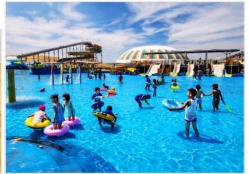
OPTION TOUR เลือกซื้อกิจกรรม สนุกสุดเหวี่ยงในทะเลทราย