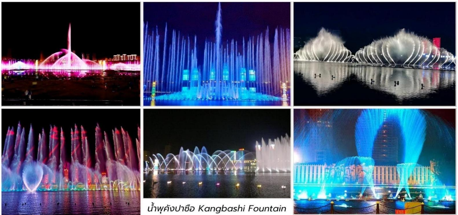
น้ำพุคังปาซื่อ Kangbashi Fountain

นำท่านชม น้ำพุคังปาซื่อ (Kangbashi Fountain, 康巴什喷泉广场)* สัญลักษณ์สำคัญของเมืองใหม่คังปาซื่อ แต่ยังคงได้รับการกล่าวขานว่าเป็นหนึ่งในน้ำพุที่สูงและยิ่งใหญ่ที่สุดในเอเชีย สามารถพ่นน้ำได้สูงถึง 230 เมตร ระบายน้ำพุคังปาซื่อไม่ใช่แค่น้ำพุธรรมดา แต่เป็นการแสดงที่ผสมผสานระหว่างการเคลื่อนไหวของสายน้ำ