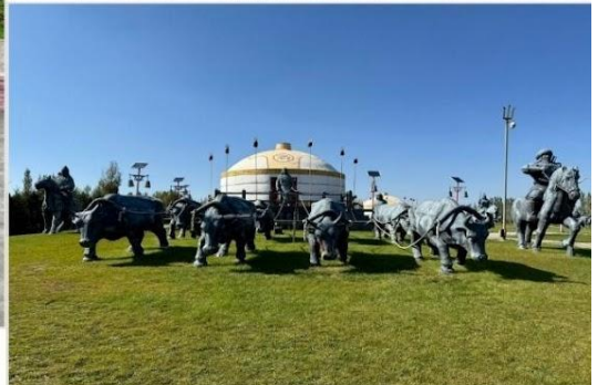
เขตท่องเที่ยวเจงกิสข่าน • กลุ่มประติมากรรม กองทัพเหล็กและกระโจมทอง