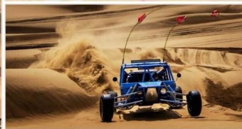
OPTION TOUR เลือกซื้อกิจกรรม สนุกสุดเหวี่ยงในทะเลทราย