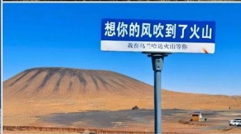
อุทยานภูเขาไฟอูลันฮาตา (Wulanhada Volcano Geopark)